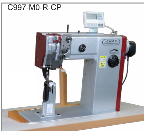
上下車輪送りポストベッドミシン

セイコーミシン本社に現在数あるラインナップの中から5機種をご用意しております。また9/20(水)-9/21(木)に東京ビックサイトで行われる54th FISMA TOKYO (東京ファッション産業機器展)に、2機種の実機展示を行います。是非一度実機での確認をしていただければ幸いです。