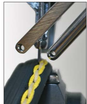
糸編み装置(オプション)