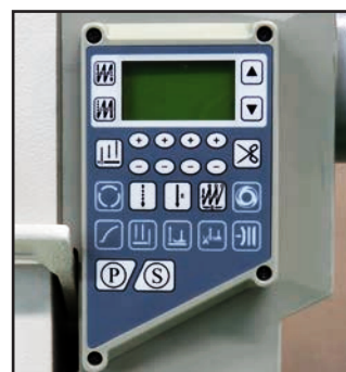
ダイレクトモーター操作パネル