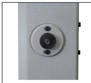
ベルトテンション調整用アイドラー