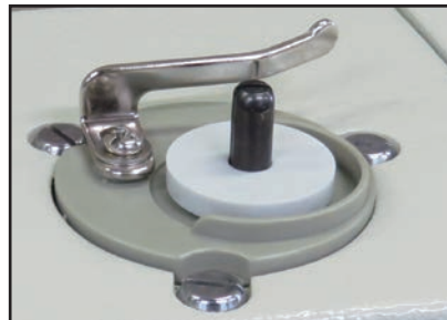
巻き量微調節機能付き 内蔵式ボビンワインダー