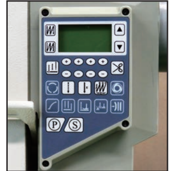
ダイレクトドライブ モーター操作パネル