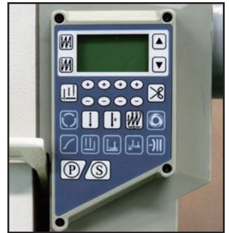
ダイレクトドライブ モーター操作パネル